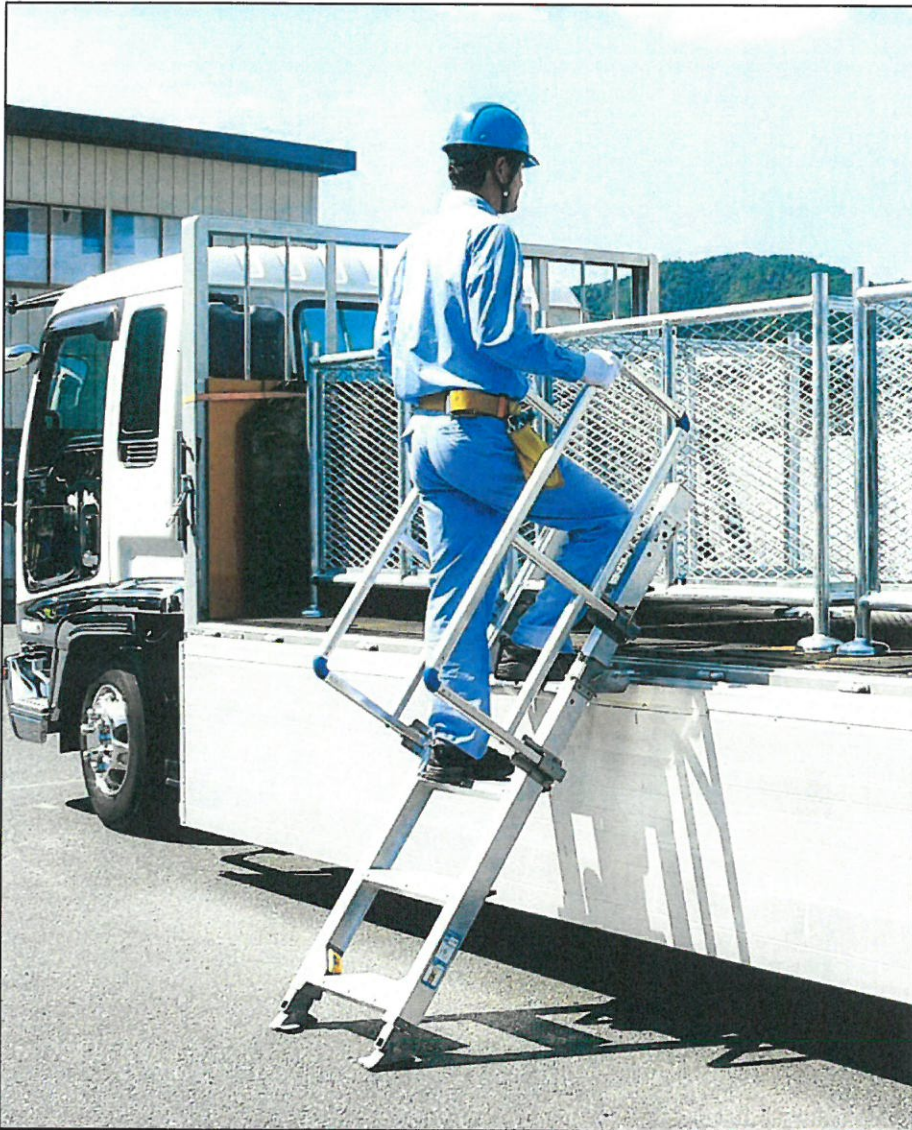
▲側面あおりを倒して設置