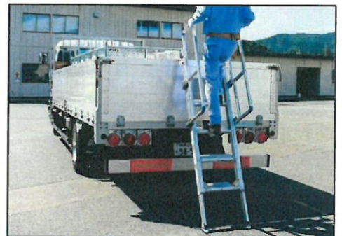
▲背面あおりに設置