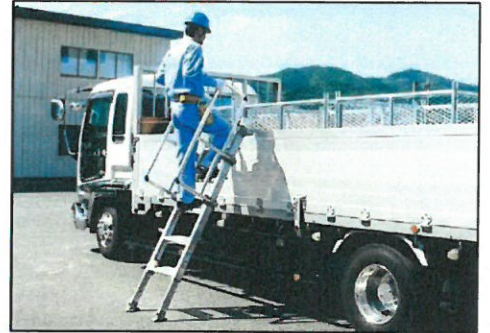
▲側面あおりに設置