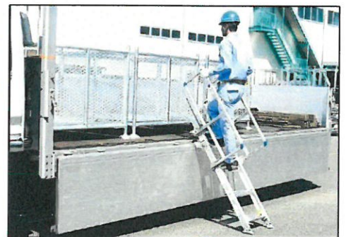
▲側面あおりを倒して設置