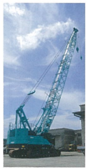
▲中部地方でも数が少ない大型クレーンも