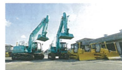
▲ブルドーザー・ショベルなどの建設機械